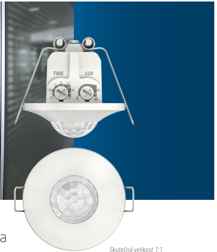
Skutečná velikost 1:1